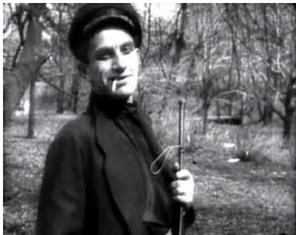
Кадр из фильма «Барышня и хулиган»

условиях и ситуациях, выглядит явно ворованным, а следовательно, вполне «хулиганским», и порождаемые с его помощью «жесты-изображения» становятся вполне понятны зрителю. Вряд ли это прямая реплика тросточки Чаплина и восходящая к фирменным жестам бродяги «Шарло» аллюзия, однако и ничего общего с «новаторской актерской техникой» здесь все же нет. Как нет ее и в