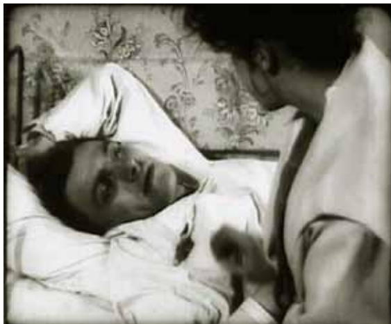
Кадр из фильма «Барышня и хулиган»

29 Википедия. Прилепин Захар // URL.: https://ru.wikipedia.org/wiki/Прилепин_Захар#cite_note-41 (дата обращения: 15.06.2018).