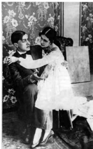
Кадр из фильма «Закованная фильмой»