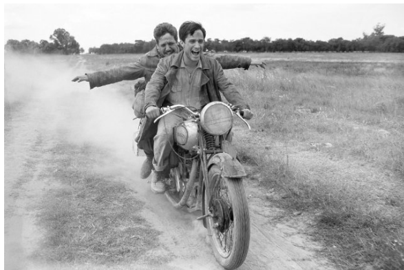
Кадр из фильма «Дневники мотоциклиста»

В следующей ленте Саллес вернулся к своему излюбленному жанру фильма-дороги и документальным источникам. «Дневники мотоциклиста» — копродукция многих стран (исполнительный продюсер Р. Редфорд) с полным правом представляет все