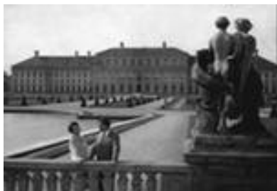
«В прошлом году в Мариенбаде». Режиссер: Аллен Рене, 1961